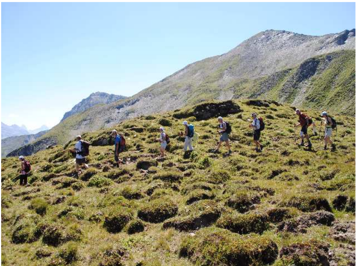
Im Abstieg vom Fulhorn (rechts)