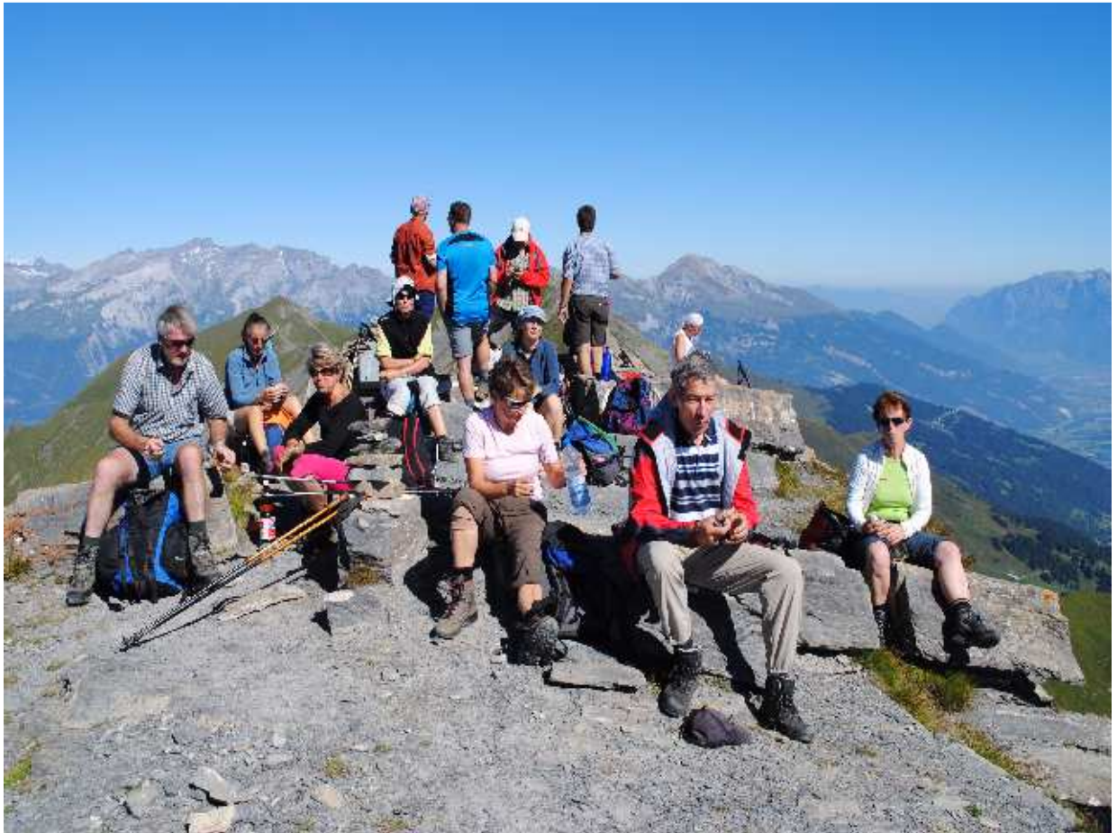
Rast auf dem Stätzer Horn