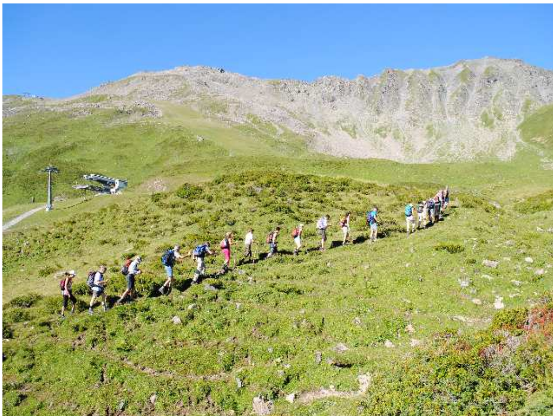
Im Aufstieg zum Stätzer Horn (links)