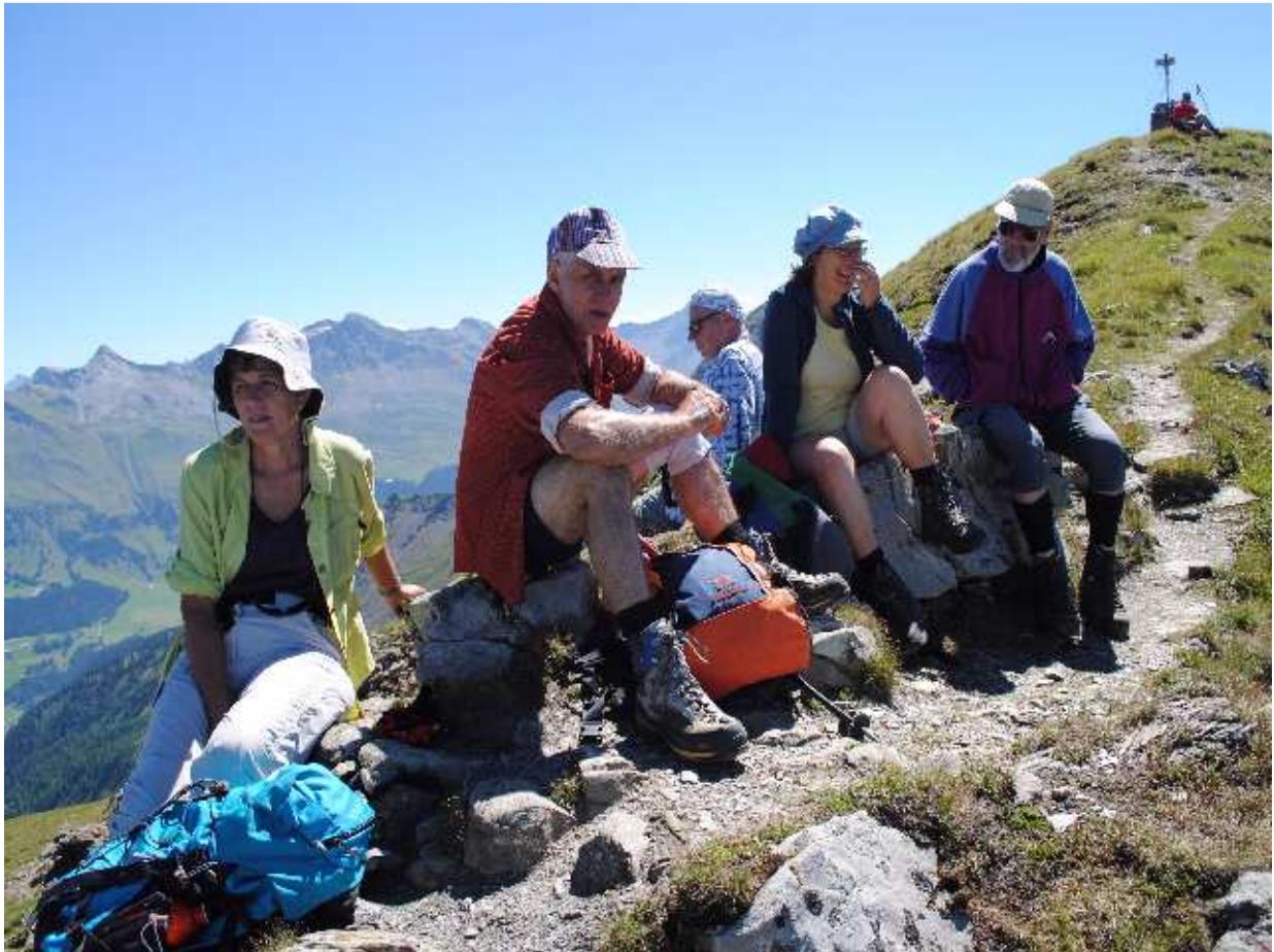
Mittagsrast auf dem Fulhorn