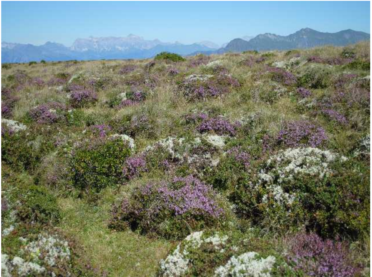
Der Herbst naht! (blühende Erikas)