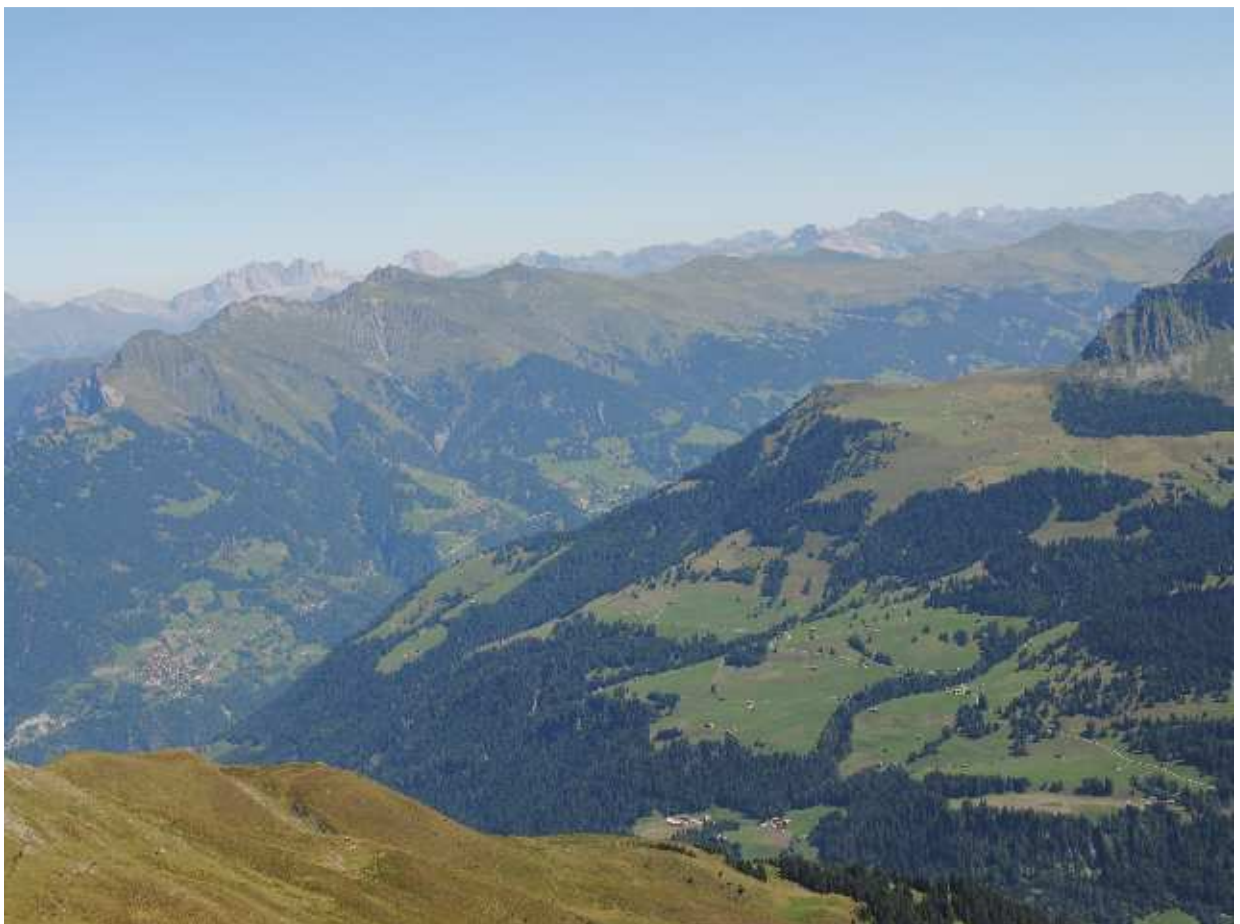
Blick zur Schanfigg, im Hintergrund der Rätikon