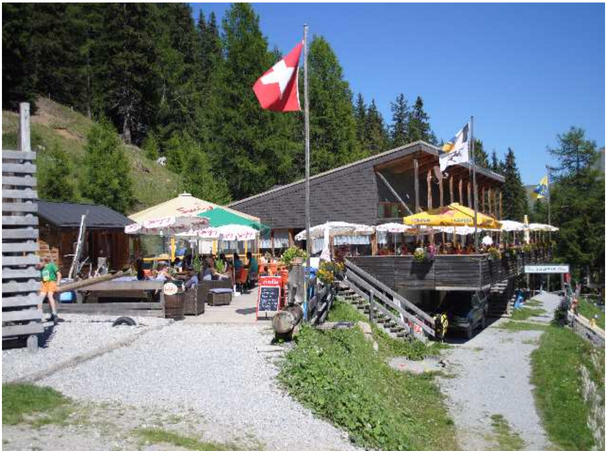
Durstlöschen im Bergrestaurant Pargitsch