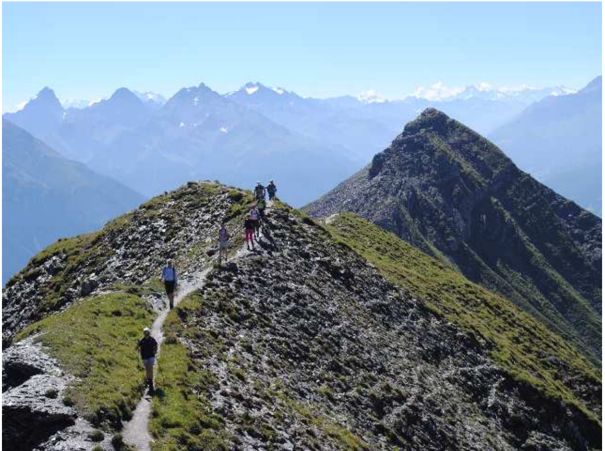
Auf dem Grat mit Blick zum Stätzer Horn